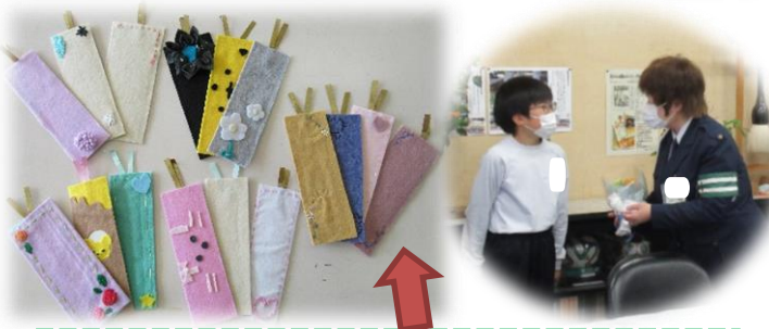
花束と6年生が作ったしおりをプレゼントしました